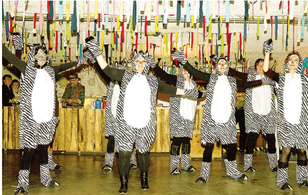
Viel geboten ist im Altdorf auch am Abend des Schmutzige Dunschtig ab 20 Uhr im Plättlebunker.