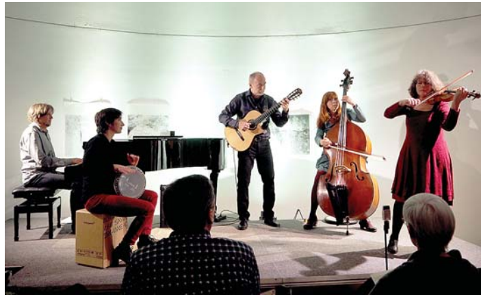
Erst nach zwei Zugaben, dem »Flat Bush waltz« und der »Kissen-Sirba«, ließ das begeisterte Publikum im Engener Museum das Ensemble »Street Melody« von der Bühne.