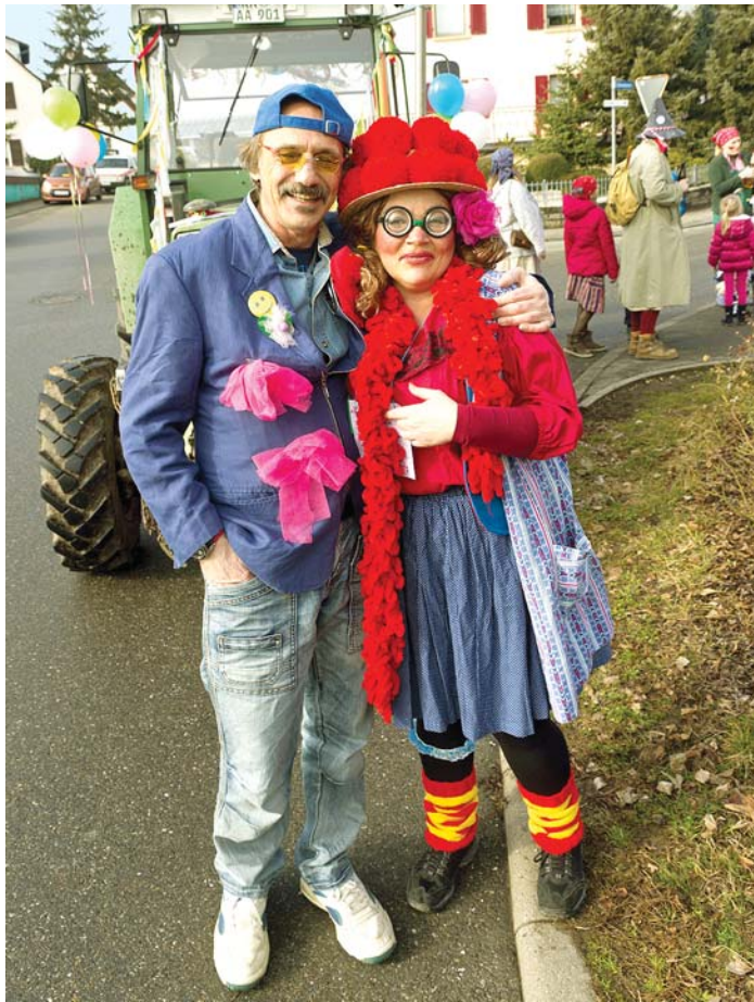
Bäuerin sucht Mann ... der wär doch was!