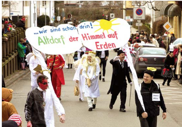
Nach guter Tradition nehmen die Altdörfler alljährlich am großen Umzug durch die Altstadt teil.

Der Kinderumzug findet am Fasnetdienstag statt. Entlang der Umzugsstrecke werden die kleinen Umzugsteilnehmer mit Süßigkeiten versorgt. Begleitet werden sie von der Jugendkapelle der Stadtmusik. Im Anschluss gibt es dann noch für alle Wurst und Wecken. Dankbar sind die Altdörfler den vielen Sponsoren, die ihnen diesen schönen Umzug ermöglichen. Besonderer Dank gilt der Jugendkapelle der Stadtmusik, die schon viele Jahre am Dienstag den Kinderumzug begleitet.